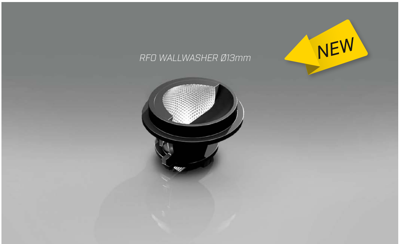
RFO WALLWASHER Ø13mm